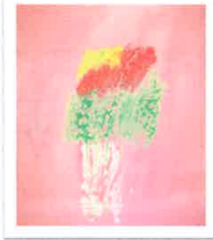
絵が得意なIさん、毎日昼休みに絵を書いています。